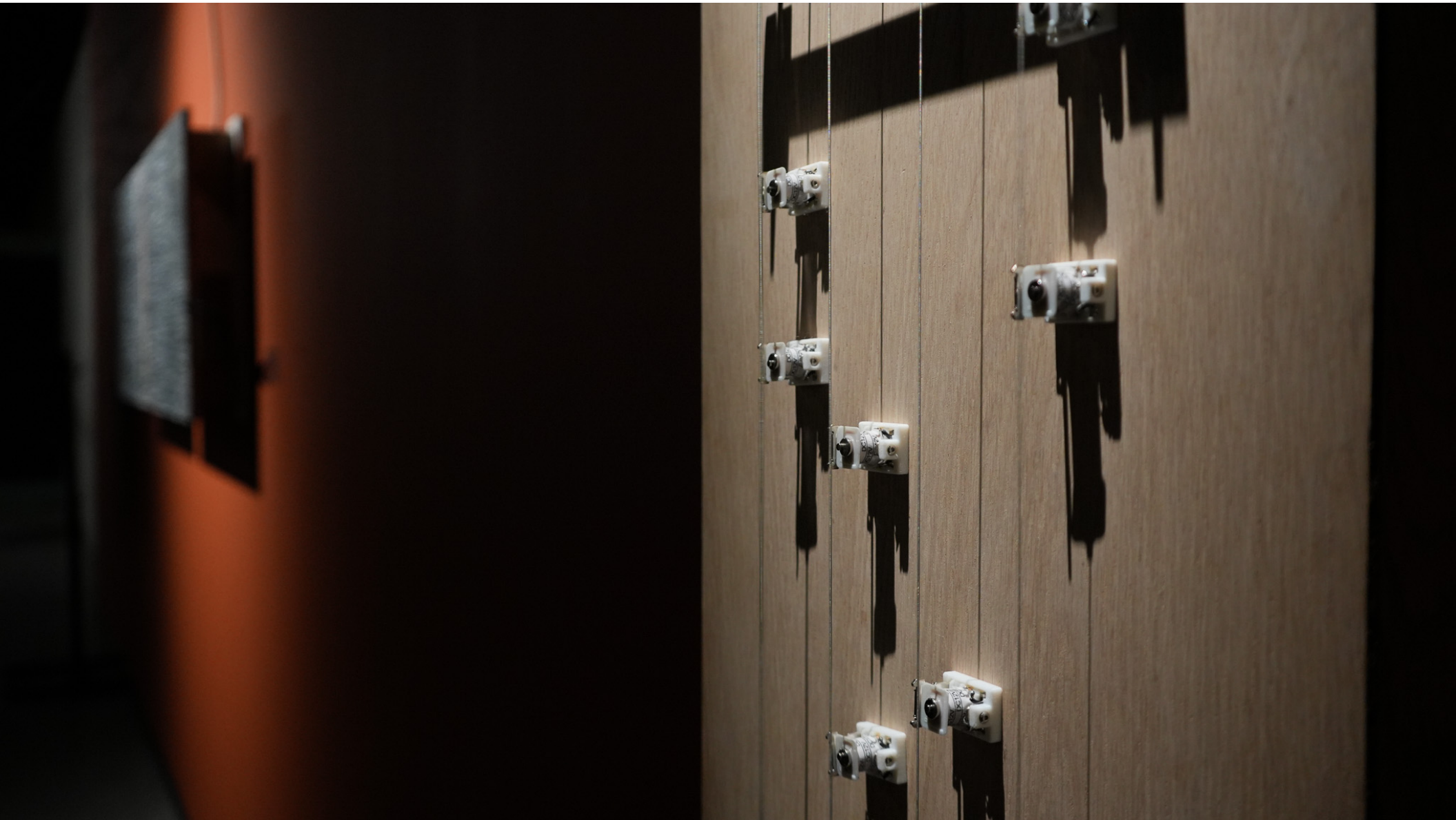
Registro de instalación.Ciudad de México, Centro de Cultura Digital. 2025.