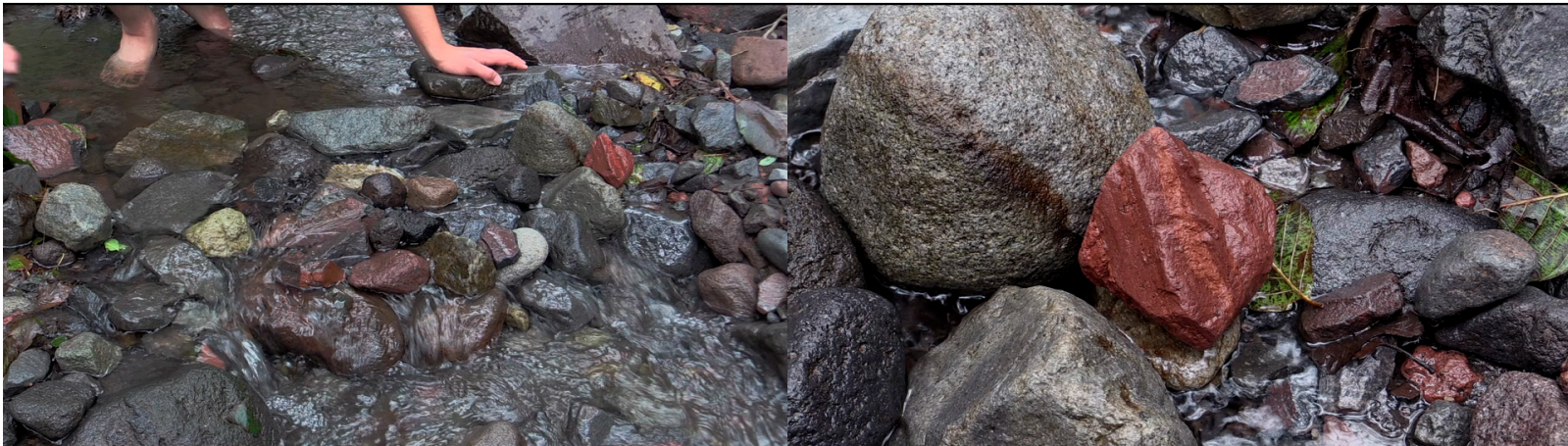
Fotograma de vídeo digital. El río solo se escucha cuando lleva agua . Amatzinac, Tétela del volcán, Morelos, 2021.

https://www.josuemartinez.net/projects/el-rio-solo-se-escucha-cuando-lleva-agua