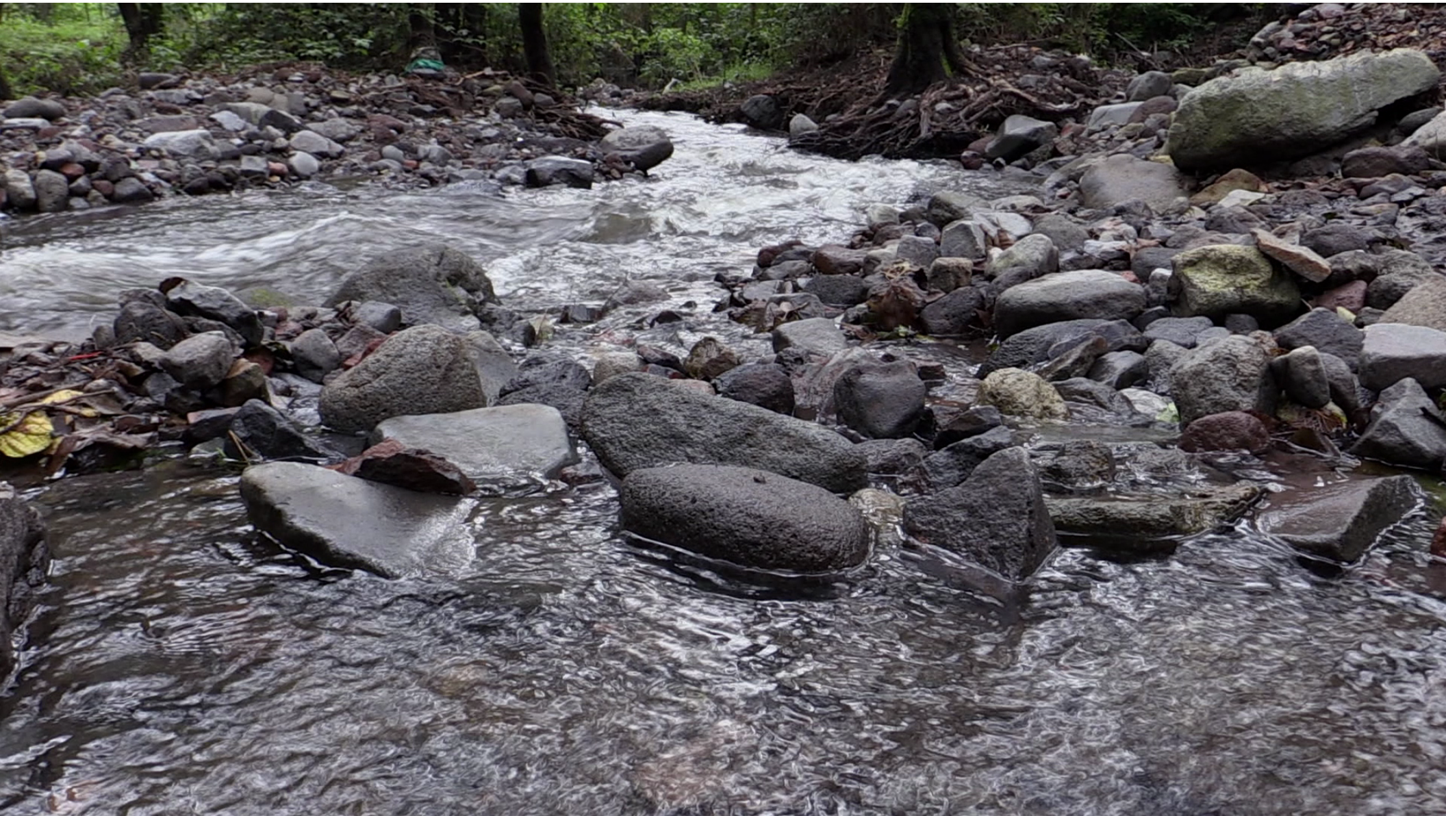
Fotograma de vídeo digital. El río solo se escucha cuando lleva agua. Amatzinac, Tétela del volcan, Morelos, 2021.