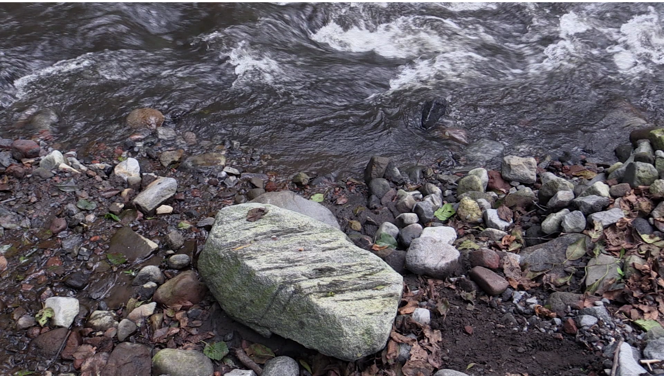
Fotograma de vídeo digital. El río solo se escucha cuando lleva agua. Amatzinac, Tétela del volcan, Morelos, 2021.