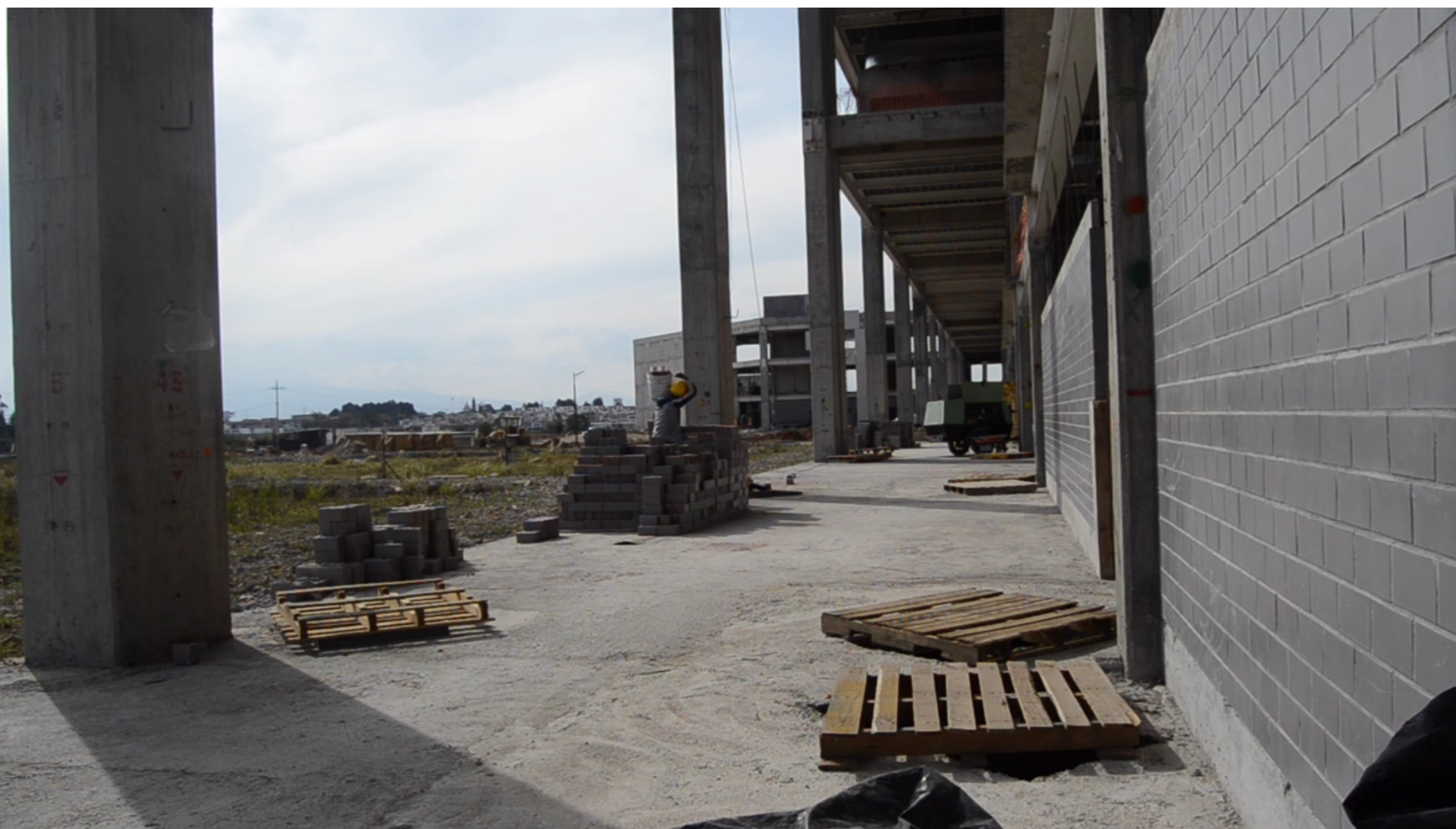
Fotograma de vídeo digital. Concierto para arquitectura olvidada . UAM Lerma, Lerma de Villada, Edo Mex. 2018.