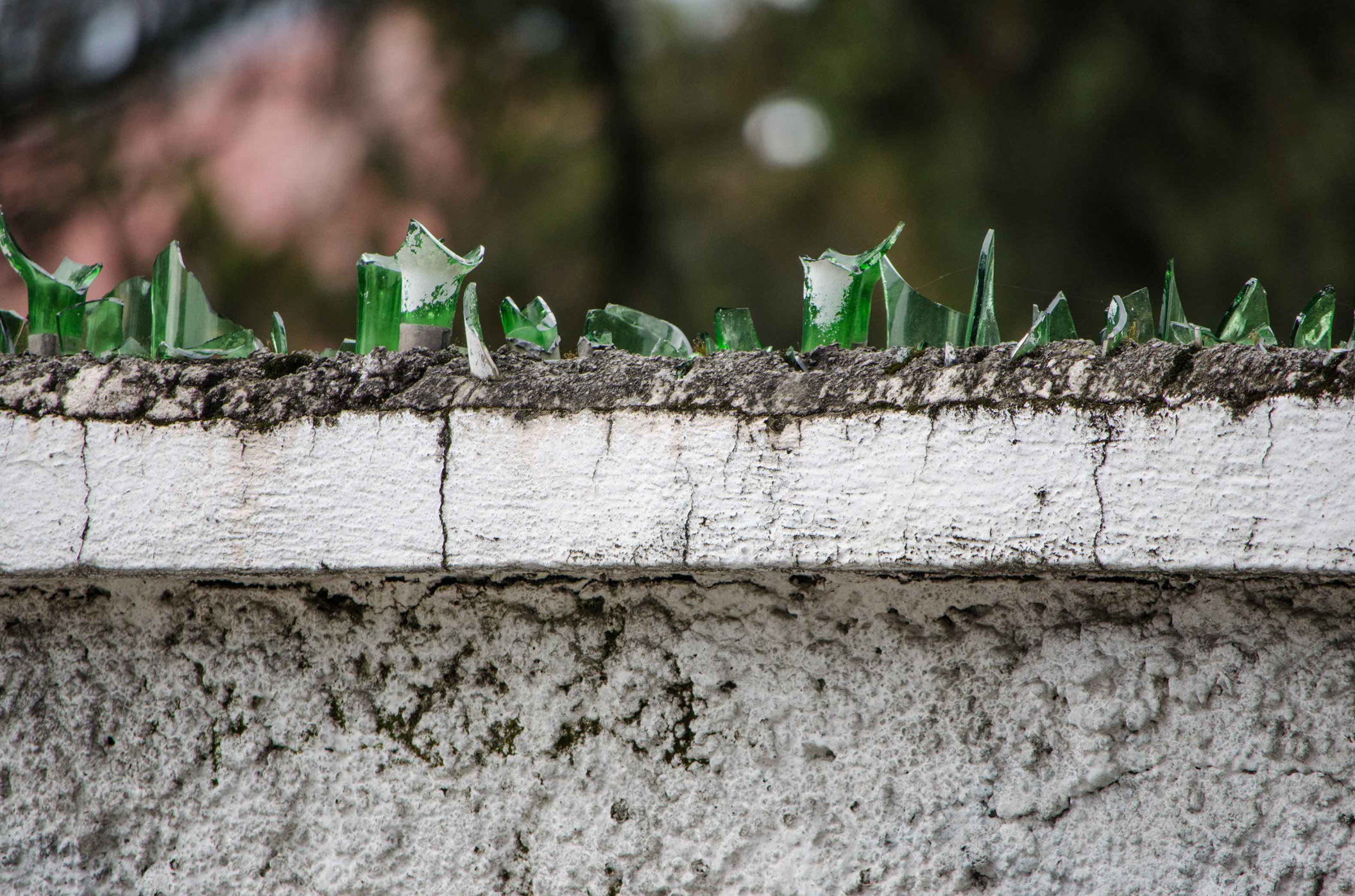
Detalle de una de las fotografías proyectadas. Sin título . Cuajimalpa, Ciudad de México. 2015.