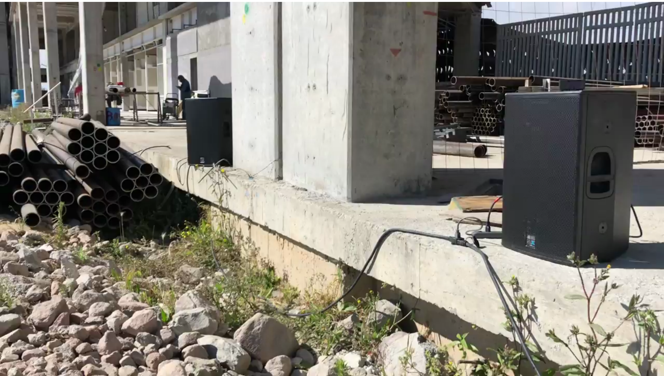
Fotograma de vídeo digital. Concierto para arquitectura olvidada . UAM Lerma, Lerma de Villada, Edo Mex. 2018.