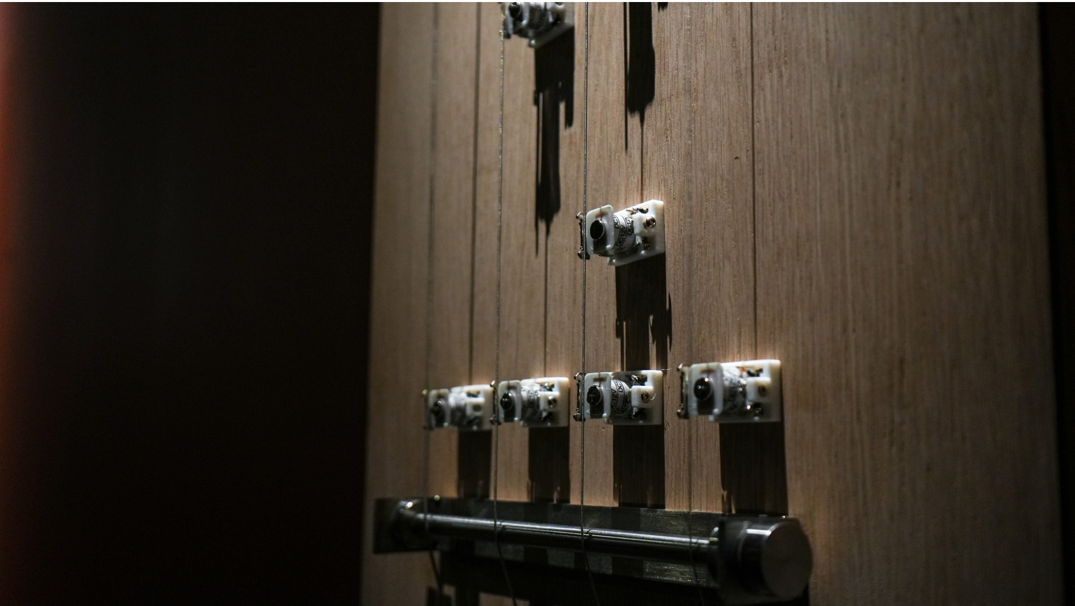
Registro de instalación.Ciudad de México, Centro de Cultura Digital. 2025.