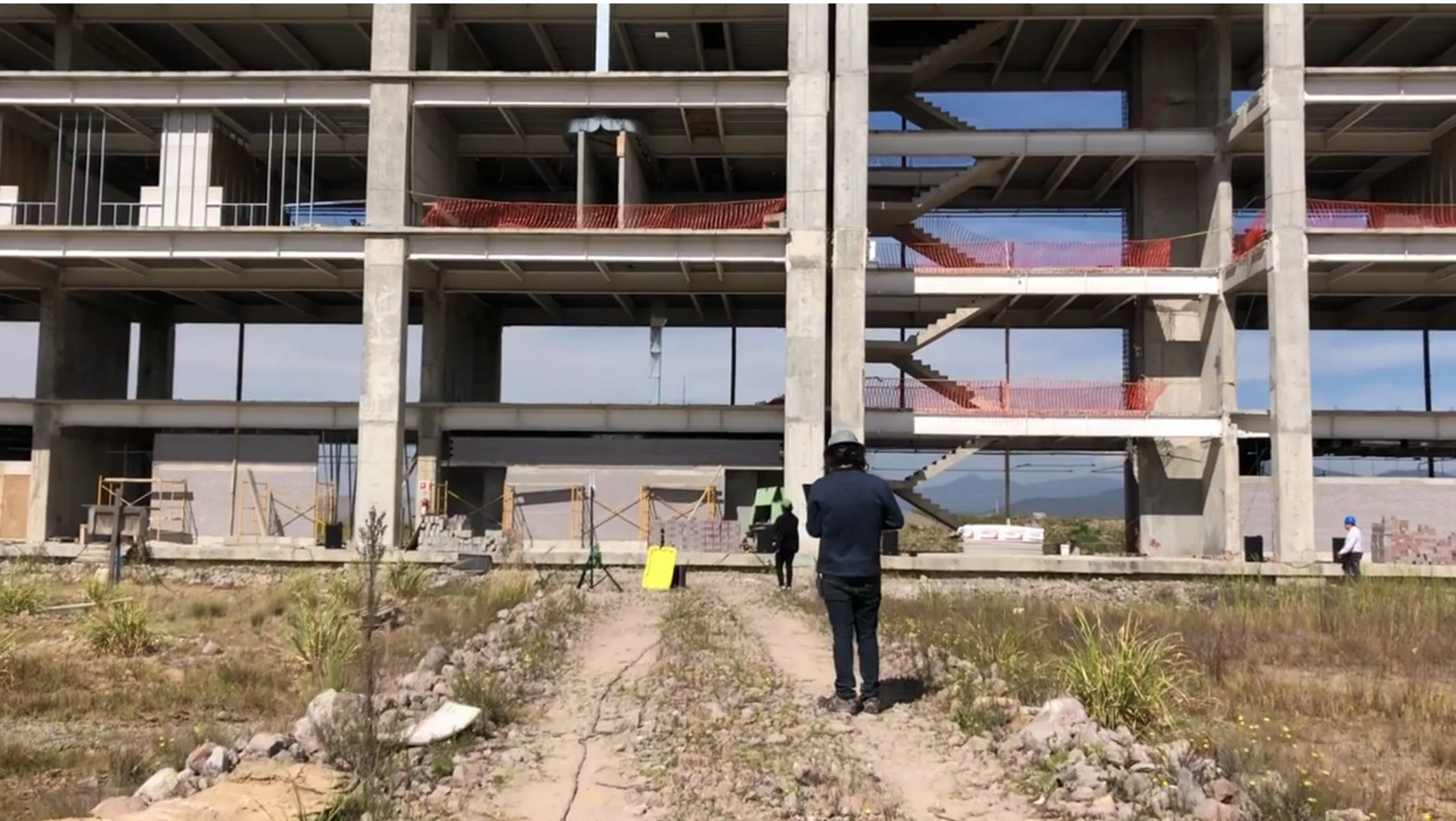
Fotograma de vídeo digital. Concierto para arquitectura olvidada . UAM Lerma, Lerma de Villada, Edo Mex. 2018.