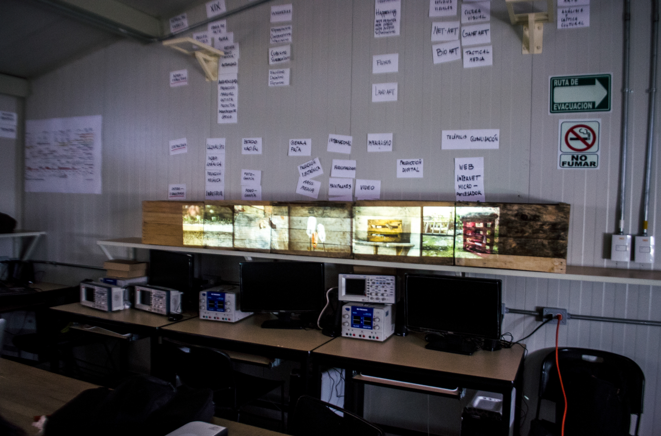
Fotografía de instalación. Sin título. UAM Lerma, Lerma de Villada, Edo Mex. 2015.