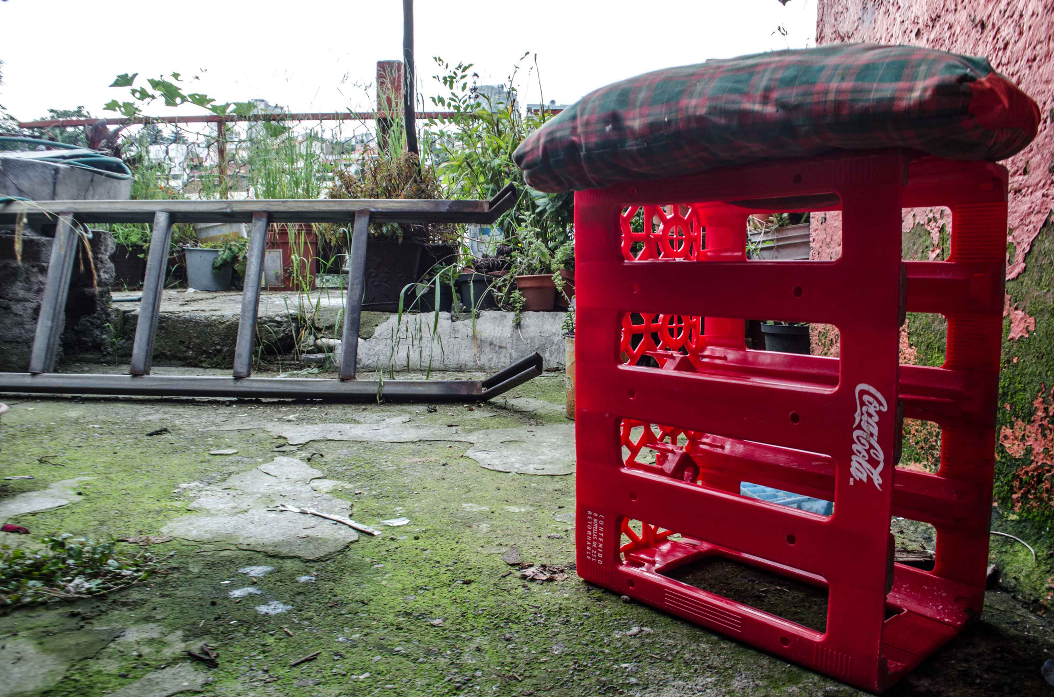
Detalle de una de las fotografías proyectadas. Sin título . Cuajimalpa, Ciudad de México. 2015.